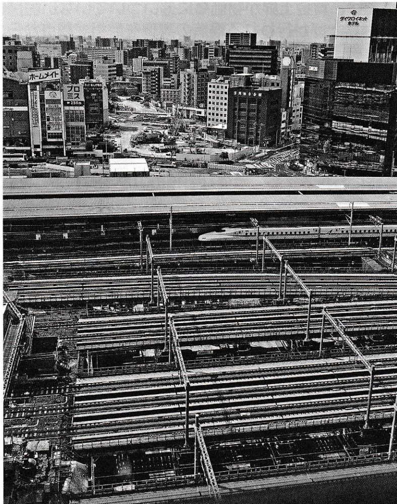
着々と工事が進みリニア中央新幹線の名古屋駅。新幹線、在来線の地下5階にホームが建設される。 (JRゲートタワーホテルから大阪方面を望む)