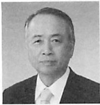
石川県間税会連合会 会長