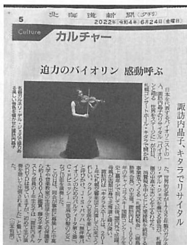
北海道新聞に掲載！

当会の諸行事の特色は元会長（現名誉顧問）の奨めた「音楽と共に」である。音楽には人々の心を癒し、団結を促す力がある。将来の善き納税者となる子供達に世界の第一線で活躍する音楽家の生の音楽を聴かせたいとの活動。今回はヴァイオリンの諏訪内晶子氏を札幌コンサートホールkitaraに招聘し、ほぼ満席の子供達は1732年製作のゲアルネリ・デル・ジェスの音色に圧倒されていた。