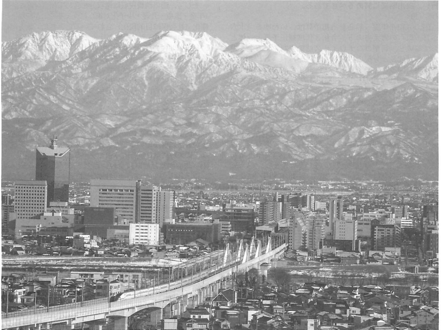
富山市街越しに望む立山連峰