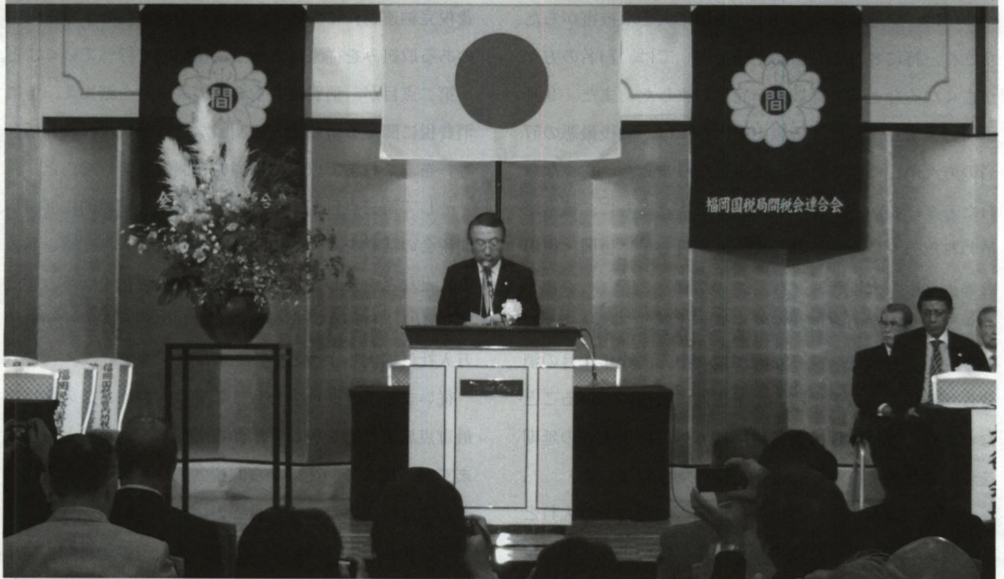
第41回通常総会 消費税期限内完納推進宣言全国大会