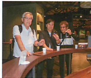
ニッカウキスキーにて（離れない人達）