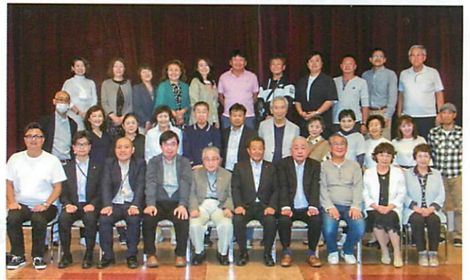
ホテル水明閣にて（余市間税会と記念撮影）

締めめのニッカウキスキー余市蒸留所では、試飲コーナーから離れない会員も現れ有意義な一時を過ごしました。