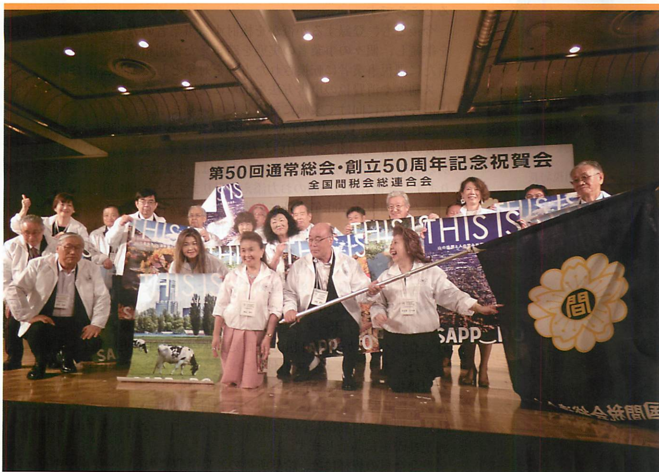
全間連全国大会（東京大会）～会旗引渡し式を終えて～