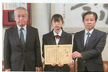
旭川市立神居東中学校の皆さん （旭川東間税会）