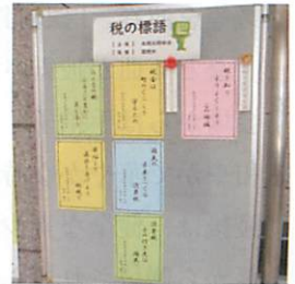
札幌北税務署では今年も 税の標語が展示されました。 （札幌北間税会）