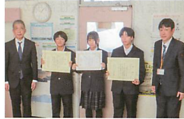
標津町立標津中学校の皆さん （根室間税会）