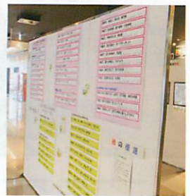
旭川では今年も「TAX SQUARE 2023」で標語を展示 （イオンモール旭川駅前4階 エスカレーター前にて展示）