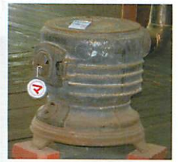
マッサンで使用されたストーブ(旧余市福原漁場)