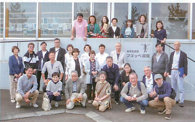
フゴッペ洞窟にて

余市町内のフゴッペ洞窟、旧下ヨイチ運上屋、旧余市福原漁場などを巡りホテル水明閣で昼食、最後はニッカウキスキー余市蒸留所で仕上げというコースです。