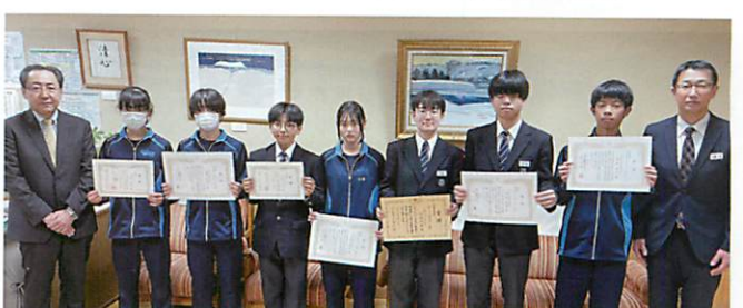
旭川市立中央中学校の皆さん（旭川中間税会）