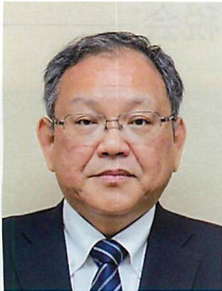
札幌国税局長 田島 伸二