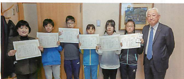
函館市立亀田小学校の皆さん（函館間税会）