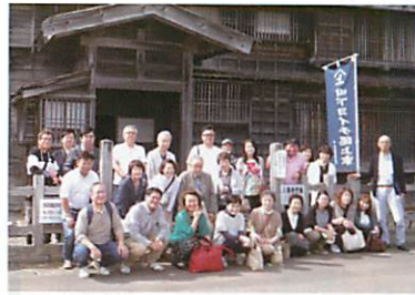
旧下ヨイチ運上屋にて

これが大好評で、分かり易さとチョットした豆知識（朝ドラ「マッサン」で使われたストーブ等）の披露もあり大変意義のある研修となりました。