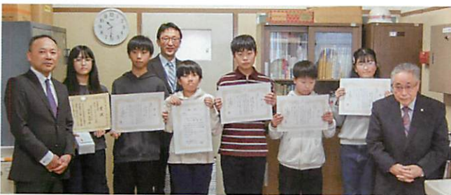
札幌市立栄東小学校の皆さん（札幌北間税会）