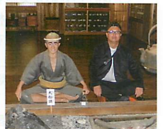
旧下ヨイチ運上屋にて（大船頭と青年部親方）