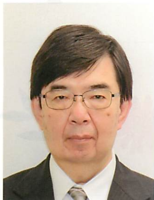
北海道間税会連合会会長