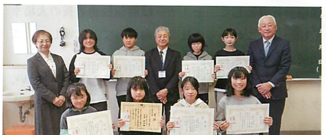
函館市立柏野小学校の皆さん（函館間税会）