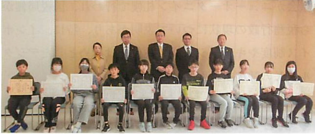
札幌市立中央小学校の皆さん（札幌中間税会）