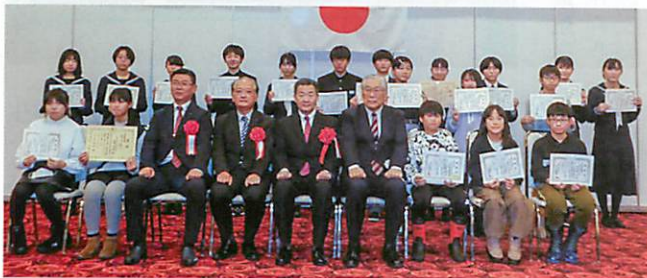
岩見沢間税会税の標語表彰式