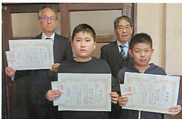
函館市立青柳小学校の皆さん （函館間税会）