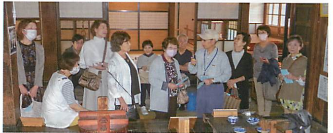
旧余市福原漁場にて

ホテル水明閣での昼食では余市間税会の会長をはじめ役員の方も参加し親睦を深めていただきました。余市間税会の皆様本当にお世話になりました。