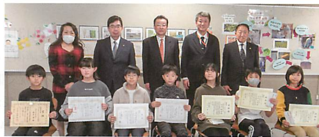
札幌市立資生館小学校の皆さん（札幌中間税会）