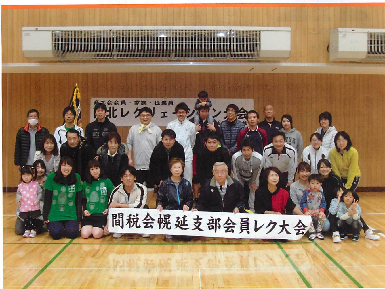
稚内税務署管内間税会連合会幌延支部の皆様 (写真コメント…10ページ)